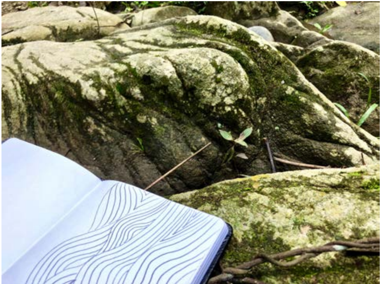
Serie Espacios de el Encanto Cuadernos de viaje Fotografía: Gotsezhi, El Encanto, 2017.

Esta compilación de obras es una retribución a la Sierra Nevada de Santa Marta y a la comunidad Wiwa de Gotsezhi, El Encanto, en especial todas las