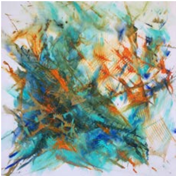
Serie Hilos de oro Tejiendo pensamientos Acrílico sobre lienzo, 0,90m x 0,90m 2021

En este paraje, la vista no se fuga hacia el infinito como la línea del mar, la línea de horizonte está solo a unos cuantos metros, pero la profundidad es absoluta. Permanentemente, se crean y recrean paisajes con el cambio de la luz, las sombras aparecen y desaparecen, las formas y los colores se fusionan, el viento mece los árboles, y los sonidos propios del lugar se enaltecen.